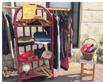
Désormais très prisés, les vide-dressing permettent de renouveler sa garde-robe à petit prix et contribuer au réemploi, point d'orgue de l'écologie.

Le 7 mai, l'association Réseau Île propose un second vide-dressing dont la recette ira à l'AFM-Téléthon.