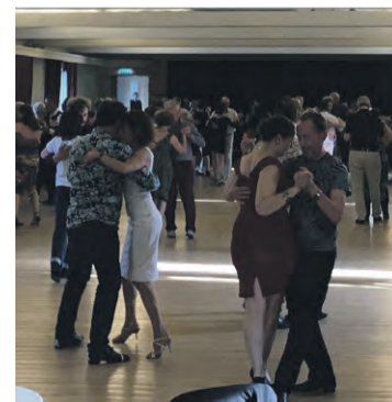
Les danses s'enchaînent sur le parquet de salle de la citadelle.

Les couples se faisaient et se défaisaient pendant que les chansons s'enchaînaient, parfois jusqu'à tard dans la nuit. « Un enchantement », « une merveille », les personnes interrogées n'avaient pas de mot assez fort pour exprimer leur plaisir d'être à nouveau ensemble pour partager leur passion pour cette danse. Et si la moyenne